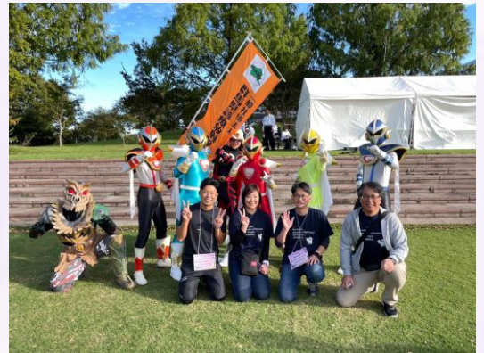
超速戦士 G-FIVEとコラボ！？